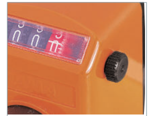
Positioning push button Nullstellungsknopf